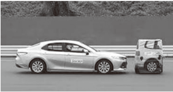
「予防安全性性能評価」に新たに追加された、ペダル踏み間違い時加速抑制（前進時）試験の様子

今回、星五個を獲得したのは、スバル「フォレスター」、トヨタ「クラウン」、トヨタ「カローラスポーツ」、トヨタ「カムリ」/ダイハツ