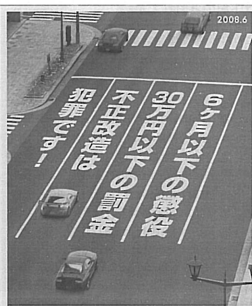
不正改造車排除強化月間

国土交通省は、関係省庁、関係団体等と連携して、平成二年度から年間を通して不正改造車の排除運動に努めています。特に、六月の一ヶ月間は「不正改造車排除強化月間」とし、ポスターやチラシ等を配布し啓蒙に努めるなど、様々な運動を全国的に展開しています。