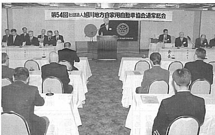
盛会に開催された第54回通常総会

今後とも、協会は会員の利便向上と安全で環境にやさしいクルマ社会を目指すために、関係官庁及び関係団体と連携を協同し積極的に取り組んで参ります。 三、法令の周知徹底と輸送秩序の確立 自動車を安全かつ円滑に使用するために、使用者をはじめ、全ての運転者が、定められた法令を遵守し日常の運行にあたるのが最も大切な事であり、 今年度においても、道路運送車両法等の改正が行われ、自動車等のマフラーに対する騒音対策のため、保安基準の細目を定める告示が制定されました。