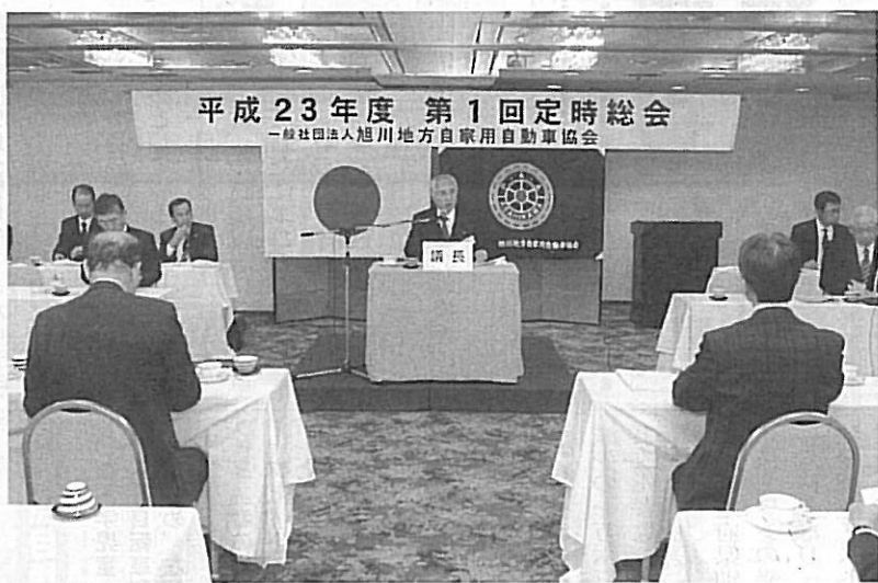
平成23年度 第1回定時総会

も重要な課題であることは申すまでもありません。平成二十三年度の会員状況は、正会員一三六名、賛助会員二九六名、合計で前年度より三十六名増加の三三〇五名となりました。会員の移動状況は、正会員では入会二名に対し、退会及び未継続で五名が減少、前年より三名減少となりました。