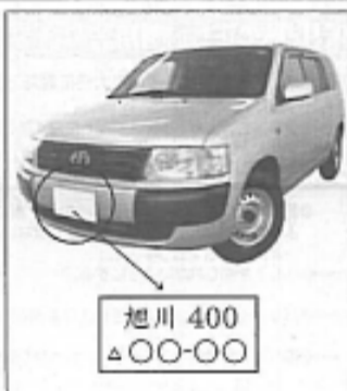
旭川 400 △〇〇-〇〇

このため、信号無視、歩道での徐行違反や歩行者妨害、通行区分違反、遮断機が下りた踏切への立入り、一時停止違反、酒酔い運転といった安全不確保や交通ルール違反、及び、スマートフォンや携帯電話を操作しながらの運転、ヘッドホンやイヤホンで音楽を聴きながらの走行、傘を差しながらの運転などといった安全運転義務違反を含む十四項目の行為を「悪質危険運転行為」と定め、この危険運転行為を繰り返した者(十四歳以上の者)に対し、安全