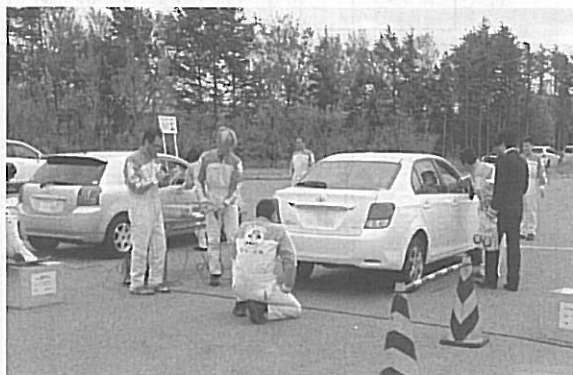
稚内市で実施された街頭検査の様子

また、同時に実施した定期点検整備実施率調査の結果は、本年度は七六・〇％と前年度の六八・六％に対し、上昇傾向では