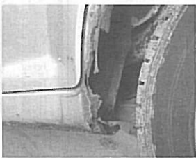
グリルなど車体凹部の突起は対象外となるほか、二輪車と貨物車及び平成二十一年十二月三十一日以前に製作された乗用車には適用しないとしている。

平成二十九年四月一日より、平成二十一年一月以降製作の乗用車に対し、後付けする部品やボディ・パネルの折り返し部分など、車体表面にある「突起部」の規制が厳しくなる。 これは国土交通省が乗用車の外装基準を、車と人の衝突・接触の際に人が負傷する危険性を減らすことを目的に、「道路運送車両の保安基準細目を定める告示」の一部を平成二十三年に改正したことによるもの。この車体外部突起に係る外装基準を同基準に適用させる準備が整う迄の間として、平成二十九年三月三十