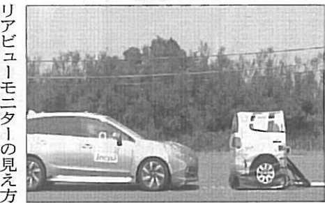
衝突被害軽減ブレーキ試験の様子

また、昨年度より開始された「衝 突被害軽減ブレーキ」や「車線逸脱 警報装置」などを評価する予防安全 性能アセスメントでは、軽自動車 (十三車種)、乗用車(十六車 種)、電気自動車等(八車種)の計 三十七車種について試験を実施。い ずれの車種においても、一定レベル 以上の性能を持つことが確認 され、インプレッサ(スバル)、レ ヴォーグ/WRX(スバル)、レガ シイ(スバル)、カローラアクシオ /カローラフィールダー(トヨ タ)、スカイライン(日産)、LS (レクサス)の六車種については、 最高得点を獲得した。なお、次年度 の予防安全性能アセスメントには、